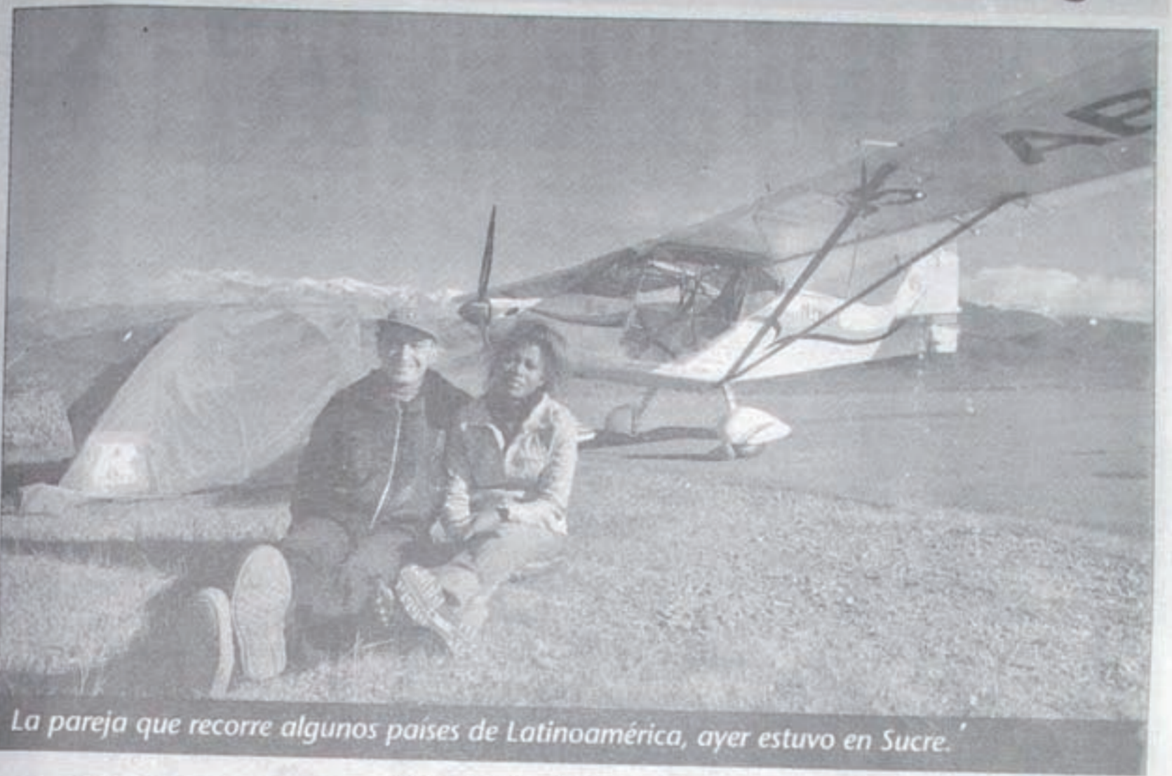
La pareja que recorre algunos países de Latinoamérica, ayer estuvo en Sucre.